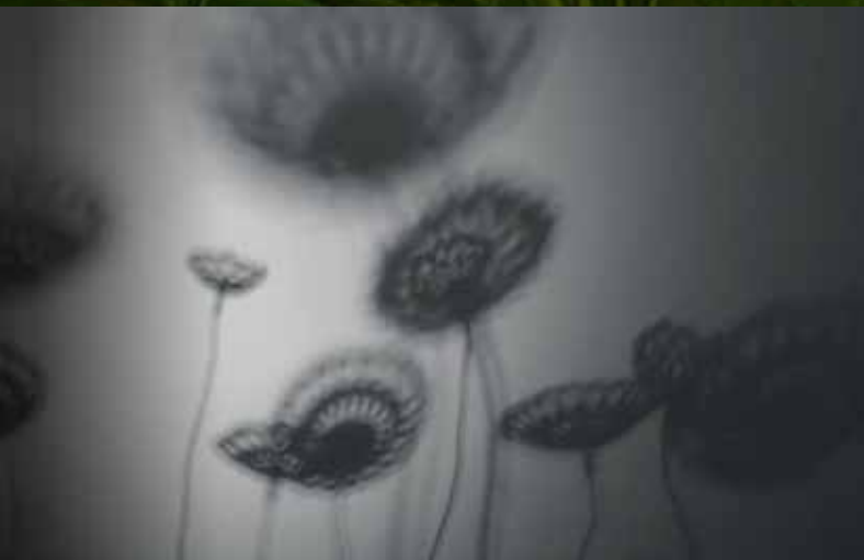
« Mouche ou le song... » Collectif A.A.O. Hugo Dayot - Carole Vergne

Les participants seront libres, en fonction de leur disponibilité, de suivre un cycle ou la globalité du parcours.